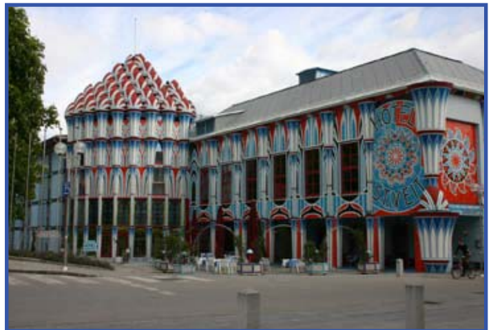
Der „Fuchs-Palast“ in St. Veit a. d. Glan / Kärnten.

-5% Sommeraktion! Gültig bis 31. Juli 2006!